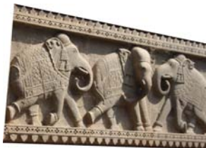
Tableau n° 2 : Ganesh.