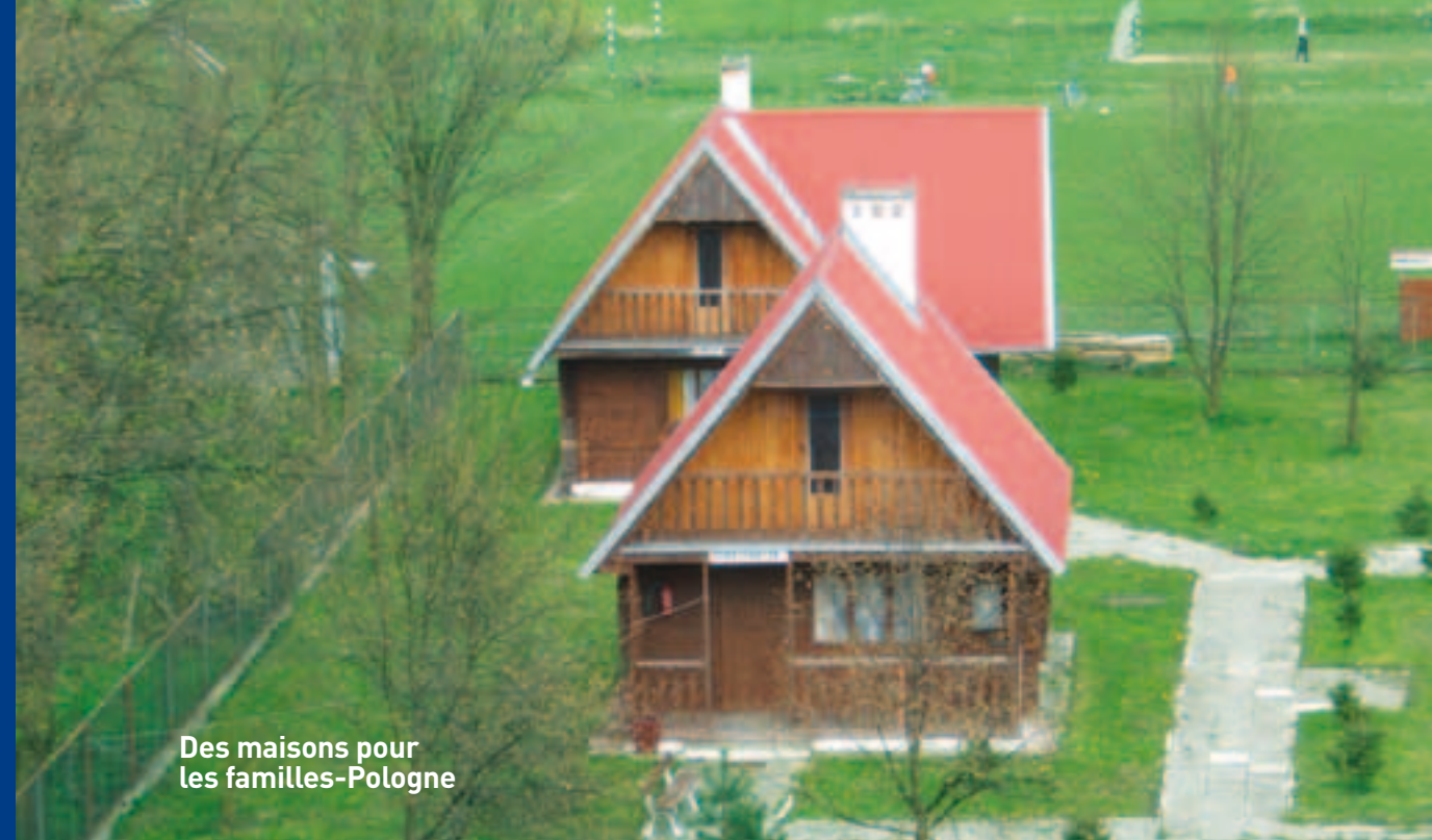
Des maisons pour les familles-Pologne