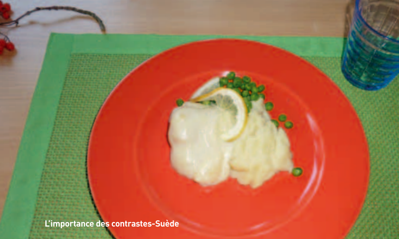
L'importance des contrastes-Suède