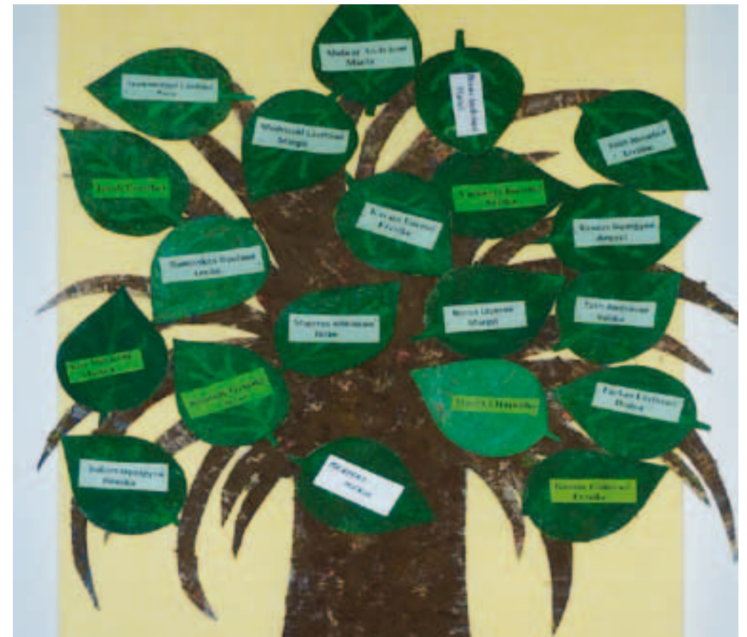
Cultiver le sentiment d'appartenance-Hongrie