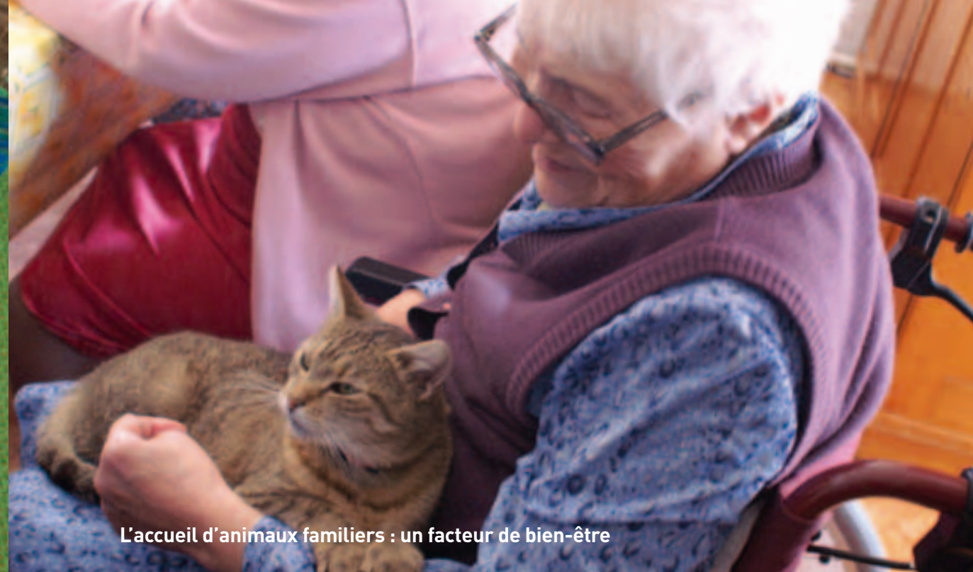
L'accueil d'animaux familiers : un facteur de bien-être