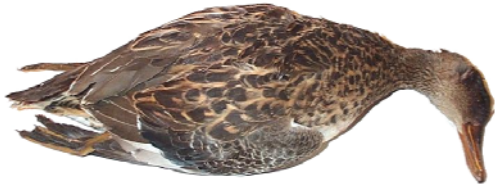
1- Poser l'oiseau sur un plan de travail droit