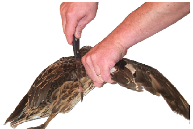
4- Couper l'aile au niveau de l'articulation de l'épaule