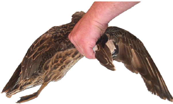
3- Prendre dans la main l'aile droite accompagnée des plumes scapulaires