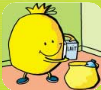
→ Pour les briques cartonnées, je fais la même chose.