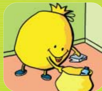
→ Du coup, je gagne de la place et j'économise les sacs jaunes !

Pour contacter les ambadrices du tri : 02 98 98 89 58