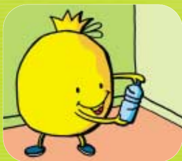
→ Cette fois-ci j'ai bien compris comment trier !