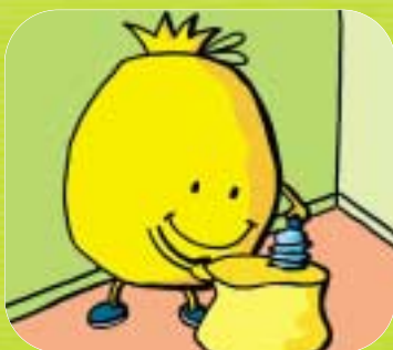
→ Je compacte mes bouteilles en plastique avant de les jeter.