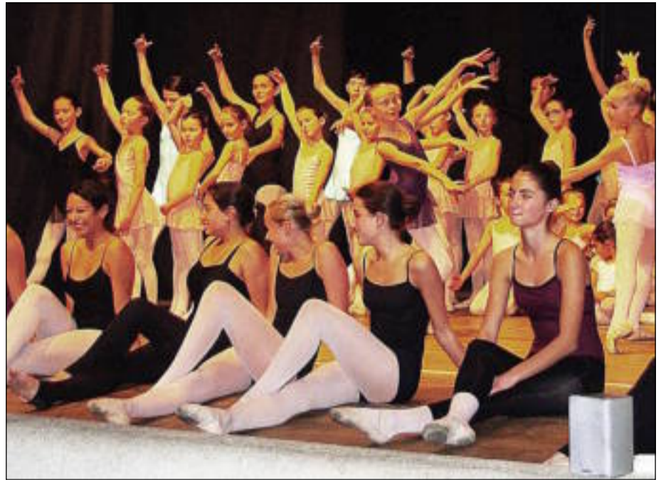
Les danseurs et danseuses des Pointes de l'avenir se sont succédé sur la scène de la salle Saint-Louis, le samedi 11 décembre.