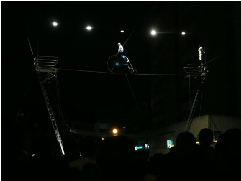
Joué-les-Tours en 2009 aux « Années Joué », festival des arts de la rue et des arts du cirque.