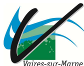
Vaires sur Marne