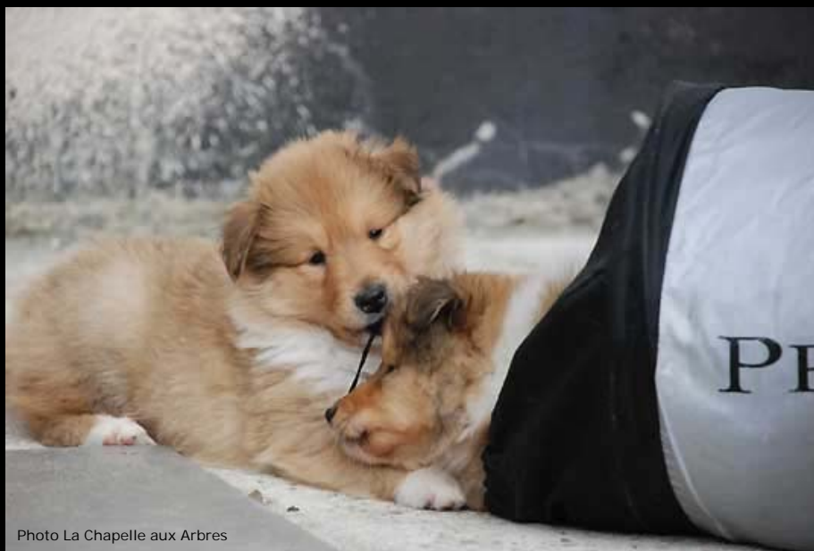
Photo La Chapelle aux Arbres