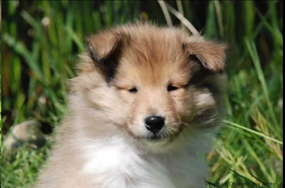
Photo La Chapelle aux Arbres