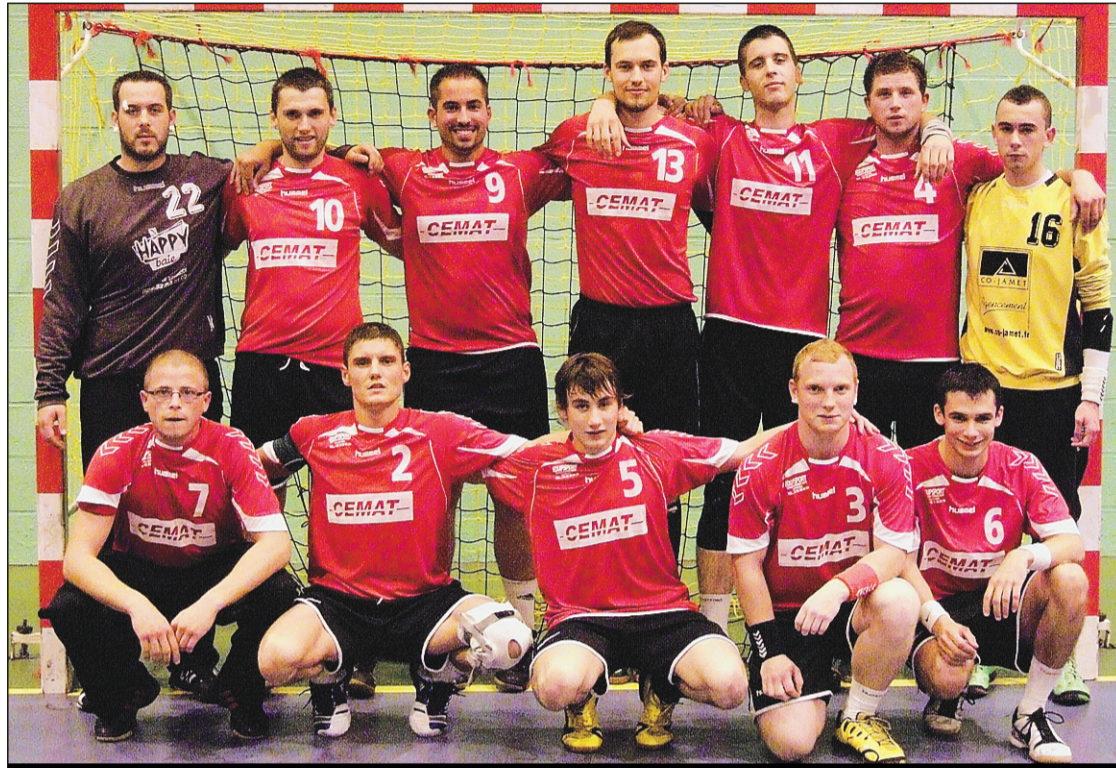
Dans la grande région havraise, derrière l'ESM Gonfreville-l'Orcher, aucun club ne se situe plus haut dans la hiérarchie que le RC Bolbec, engagé au deuxième échelon régional