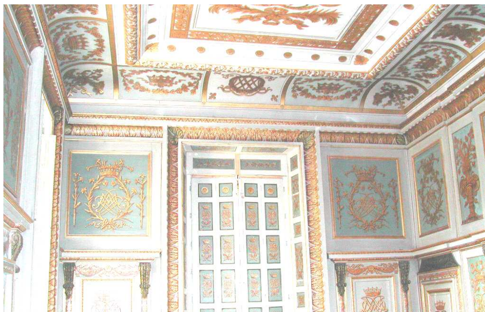
Lambris en bois peint et doré