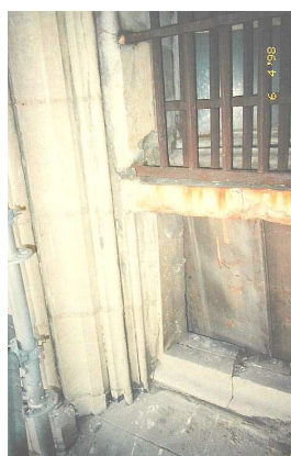
Photographie de l’état actuel d’une baie