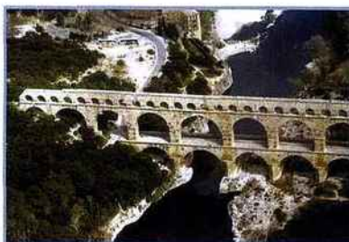
La Gaule narbonnaise , éd. Picard. Le pont du Gard (aqueduc de Nîmes).

L'auteur, spécialiste reconnu, fait la synthèse des manifestations de la romanisation dans l'urbanisme et l'architecture en Gaule méridionale, appelée aussi transalpine avant sa réorganisation au I er siècle avant J.-C. Le segment historique considéré est marqué par l'ampleur de l'héritage de la période