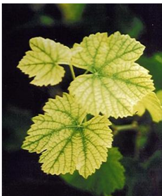
Chlorose ferrique

Ainsi, dans les cas où le risque potentiel de chlorose est important, lié à des facteurs structurels :