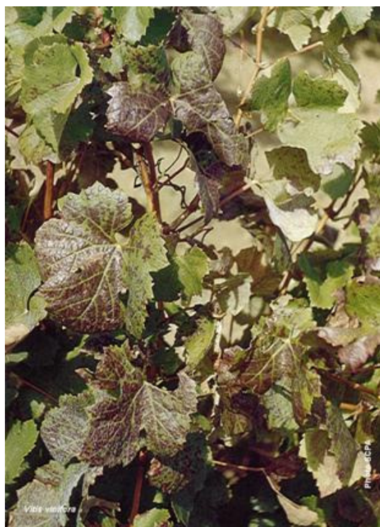
Carence en Potassium

Dans tous les cas, Les techniciens d' ALSACE APPRO seront de précieux conseils pour vous guider vers le type de correction et le choix de produits les mieux adaptés.