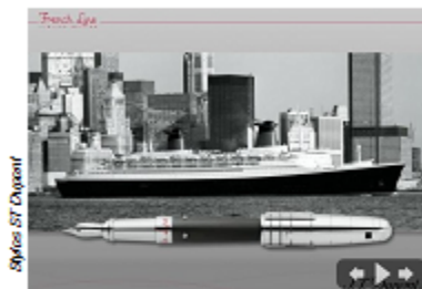
Stylus ST. Dupont