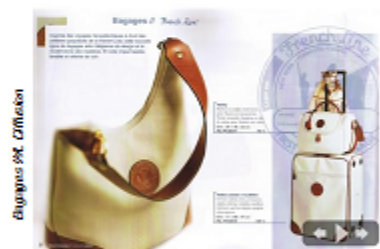
Bagages PC. Clifton