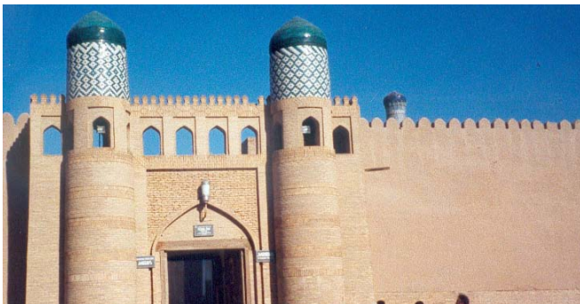
Porte principale de la citadelle (l'Ark) de Khiva, protégée par des murailles de briques cuites.

Qu'aurait été l'histoire de ce monde sans mon peuple qu'il y a longtemps déjà, régnait sur l'ancienne terre ? Suis moi voyageur que je te raconte cela . . .