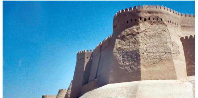
L'Ark entourant la vieille ville de Khiva.