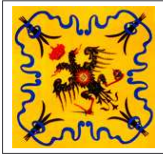
Stemma della contrada dell'aquila