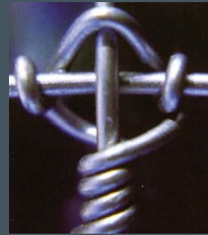
TAILLE DES FILS ET RÉSISTANCE À LA TRACTION

La rigidité du système de fixation Tornado Titan est due à un hauban vertical continu qui est fixé aux fils par un nœud non glissant innovant. Tornado Titan est caractérisée par son exceptionnelle résistance aux impacts. Elle est donc idéale pour les applications soumises à de fortes pressions.