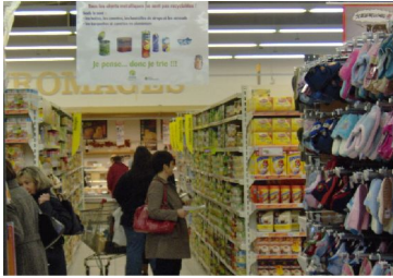
L'eco-consommation à l'Intermarché de Saint Flour avec les ambassadeurs du tri, lors de la Semaine du Développement Durable en avril.