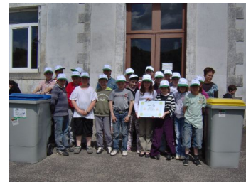
Classe de CMI-2, école primaire publique d'Allanche

Aidées des Ambassadeurs du Tri du Syndicat, plusieurs écoles primaires ont pu cette année former au tri certaines de leurs classes. Au vue de la motivation de ces ambassadeurs en herbe, il est clair que nous avons effectivement besoin de plus petits que soit pour nous montrer l'exemple !!