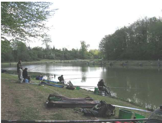
Le lac de Blasimon